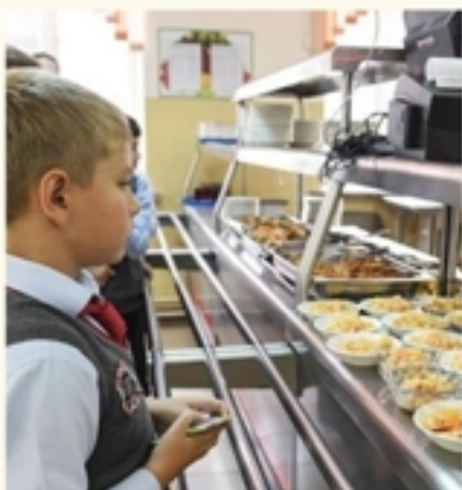
Учащиеся 1 - 4 классов